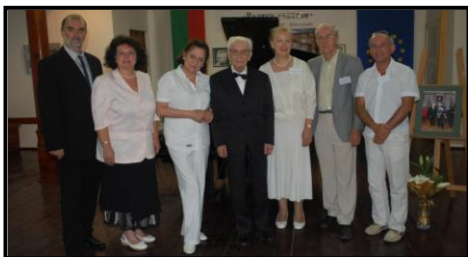
Жюри Первого Международного фестиваля - конкурса «Великие учителя», 2012

искусствоведами и литераторами из Болгарии и России.